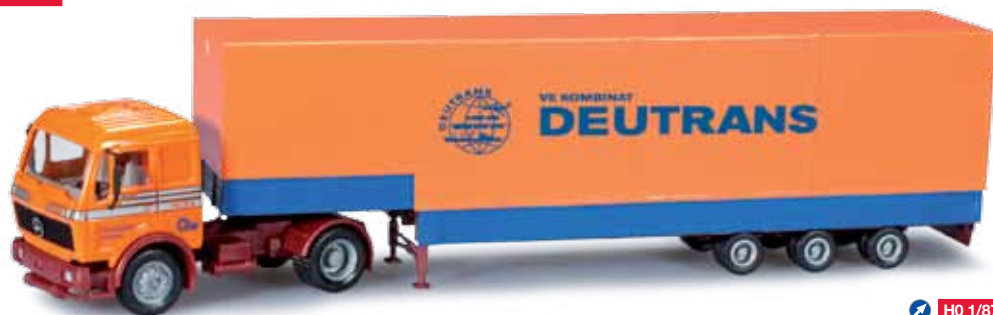
303118 Mercedes-Benz Volumen-Sattelzug / Mercedes-Benz volume semitrailer „Deutrans“ Nach mehrjähriger Pause werden bei Herpa jetzt wieder Modelle der ehemaligen Spedition Deutrans erscheinen. Der Volumenaufleger war seinerzeit in der ehemaligen DDR eher ein Exot. / After a several year break, Herpa will now once again release models of the former forwarder Deutrans. In the former GDR, the volume trailer was rather rare then.