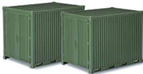
744713 Zubehör 10 ft. Gerätecontainer, 2 Stück Accessory 10 ft. equipment box, 2 pieces