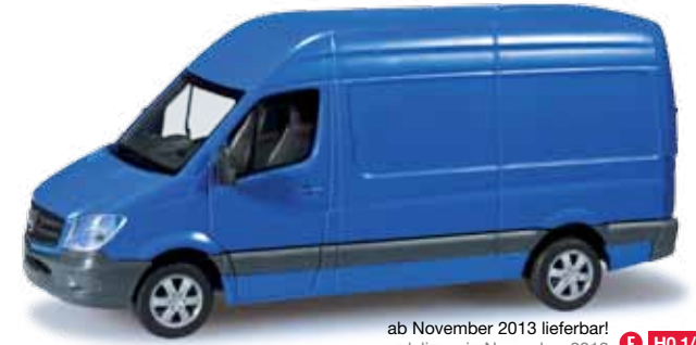
ab November 2013 lieferbar! delivery in November 2013 F HO 1/87 12,00 €