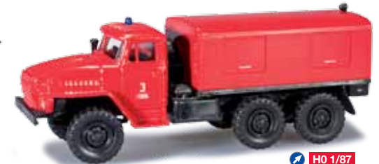
744706 URAL Gerätekofter-LKW / URAL truck with equipment box „Feuerwehr“