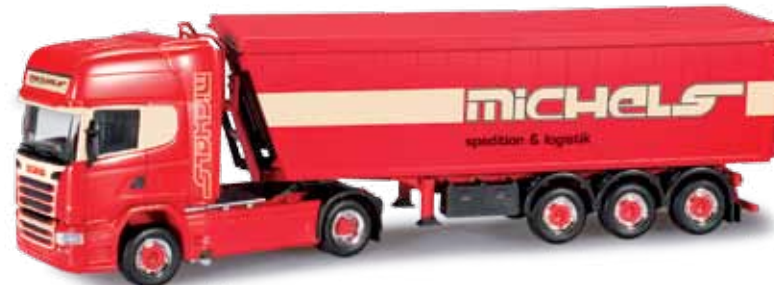
303088 Scania R '13 TL Stöffel-Liner-Sattelzug / Scania R '13 TL Stöffel-Liner truck semitrailer „Michels“ Die Westerwälder Spedition Michels stellt das Vorbild für den Kempf Stöffel-Liner, der von einer brandneuen und sehr aufwändig gestalteten Scania R 13 Topline Zugmaschine gezogen wird. / The forwarder Michels from Westerwald operates the original of this Kempf Stöffel-Liner, pulled by a brand-new and very elaborately designed Scania R 13 Topline rigid tractor.