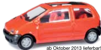
ab Oktober 2013 lieferbar! delivery in October 2013 021517-002 Renault Twingo Farbneuheit: hellrot / light red 10,50 €