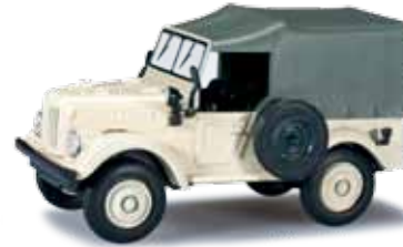
027595 GAZ 69 zivil, sandbeige In nicht militärischer Farbgebung ergänzt der aufwändig produzierte GAZ 69 mit Planenverdeck in sandbeige das Herpa PKW-Programm. / The elaborately produced GAZ 69 with canvas cover in non-military sand-beige enhances the Herpa car product range. 11,50 €