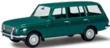
ab Oktober 2013 lieferbar! delivery in October 2013 022903-002 Wartburg 353 '66 Farbneuheit: opalgrün / opal green 9,50 €