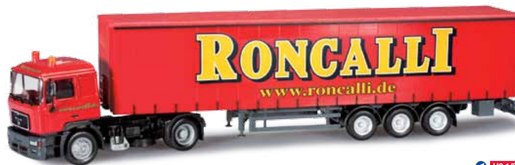
303033 MAN F2000 Gardinenplanen-Sattelzug / MAN F2000 curtain canvas semitrailer „Roncalli“ Bei der Umsetzung des Circus Roncalli zu neuen Einsatzorten findet auch der MAN F 2000 weiterhin seine Verwendung. Das Design des Auflegers unterscheidet sich gegenüber dem bereits bei Herpa erschienenen MAN TGA Sattelzug. When relocating, the circus Roncalli also operates the MAN F 2000. The trailer design differs from the MAN TGA semitrailer previously released by Herpa.