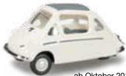
ab Oktober 2013 lieferbar! delivery in October 2013 027519-002 Heinkel Kabine Farbneuheit: weiß / white 12,50 €