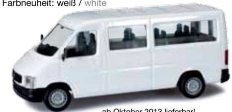
ab Oktober 2013 lieferbar! delivery in October 2013 012362-003 Minikit VW LT2 Bus Farbneuheit: reinweiß / pure white 3,95 €