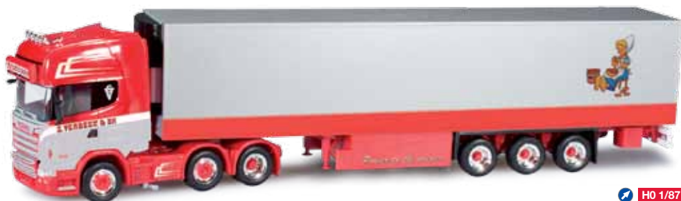
303149 Scania R TL Kühlkoffer-Sattelzug / Scania R TL refrigerated semitrailer „Verbeek“ (NL) Hollands bekannteste Kartoffelhändler setzen vornehmlich auf Scania Zugmaschinen. Der sehr auffällig gestaltete Scania 6x2 zieht einen Kühlkoffer-Aufleger, der heckseitig ein Motiv trägt. / Holland's most famous potato traders mainly opt for Scania rigid tractors. The very strikingly designed Scania 6x2 pulls a refrigerated box trailer featuring a motif in the rear.