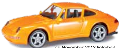
ab November 2013 lieferbar! delivery in November 2013 012348-003 Minikit Porsche 911 Farbneuheit: verkehrsorange / traffic orange 3,95 €