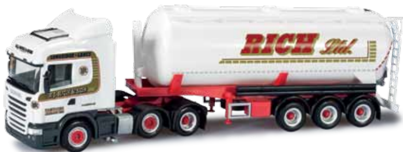
302975 Scania R '09 HL Silo-Sattelzug / Scania R '09 HL silo semitrailer „R.J. Rich & Son Ltd.“ (GB) Nördlich von Liverpool ist das Transportunternehmen R.J. Rich & Son Ltd ansässig. Mit DAF und Scania Zugmaschinen werden vornehmlich FFB Siloaufleger und Schüttgutaufleger innerhalb des Königreichs gezogen. / The transport company R.J. Rich & Son Ltd. is based north of Liverpool. With DAF and Scania rigid tractors, mainly FFB silo trailers and bulk cargo trailers are operated within the kingdom.