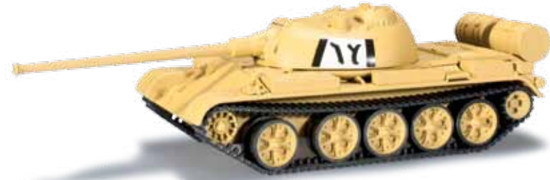
744607 Kampfpanzer T 54 / Fighting tank T 545 „Ägypten“