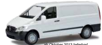
ab Oktober 2013 lieferbar! delivery in October 2013 048927-003 Mercedes Benz Vito Kasten Farbneuheit: weiß / white 10,00 €