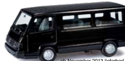
ab November 2013 lieferbar! delivery in November 2013 012317-003 Minikit Mercedes-Benz 100 D Bus Farbneuheit: tiefschwarz / deep black 3,95 €