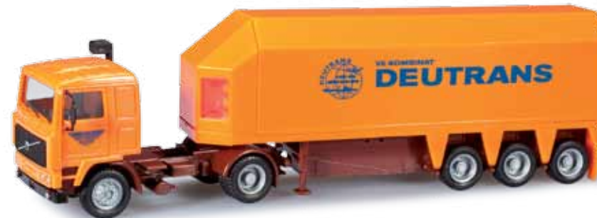
303156 Volvo Glastransporter-Sattelzug / Volvo glass transport semitrailer „Deutrans, Kraftverkehr Torgau“ Die Flotte der Deutrans-Innenlader war seinerzeit beim Kraftverkehr Torgau in unmittelbarer Nähe des Flachglaswerkes beheimatet. / The fleet of Deutrans inloaders was then based at motor traffic Torgau in the immediate vicinity of the flat glass plant.