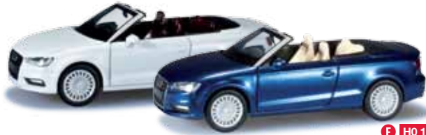
028301 / 038300 Audi A3® Cabrio / Audi A3® Cabrio, metallic Formneuheit! In den Farben scubablau perlfeffekt und ibisweiß präsentiert Herpa das neue Audi A3® Cabriolet kurz nach der Vorstellung des Originals im Herpa Programm mit neuen Felgen und umfangreicher Gestaltung inklusive Typenbezeichnung. / New type! Herpa presents the new Audi A3® convertible shortly after the original's presentation featuring new rims, more comprehensive design and type designation in scuba-blue with pearl effect and ibis-white. 11,50 € / 12,50 €