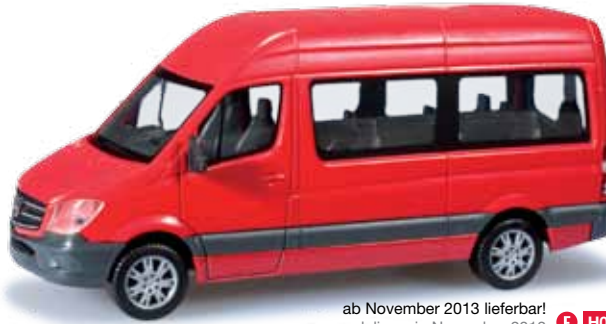
ab November 2013 lieferbar! delivery in November 2013 F HO 1/87 12,00 €