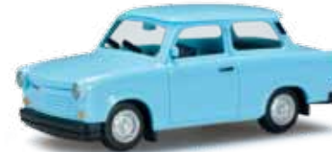
ab Oktober 2013 lieferbar! delivery in October 2013 027342-002 Trabant 1.1 Limousine Farbneuheit: pastellblau / pastel blue 9,50 €