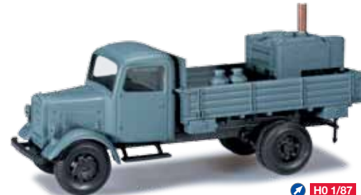
744690 Mercedes-Benz Pritschen-LKW mit Feldküche / Mercedes-Benz truck with platform and field kitchen