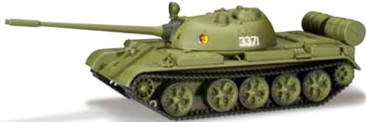
744614 Kampfpanzer T 55 / Fighting tank T 55 „NVA“