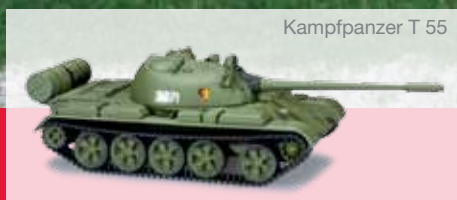
Kampfpanzer T 55