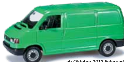
ab Oktober 2013 lieferbar! delivery in October 2013 012386-003 Minikit VW T4 Kasten Farbneuheit: minzgrün / mint green 3,95 €