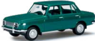
ab Oktober 2013 lieferbar! delivery in October 2013 024150-002 Wartburg 353 Tourist '66 Farbneuheit: opalgrün / opal green 9,50 €