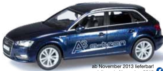
ab November 2013 lieferbar! delivery in November 2013 F HO 1/87 14,50 €

The new Mercedes-Benz Sprinter, modernized with a slight facelift of the front, is released as bus and box wagon with high roof promptly after the presentation of the original. The bus is produced in traffic red, the box wagon in ultramarine. Furthermore, the new Mercedes-Benz Econic is premiered. The first edition is an interchangeable load vehicle with a fire brigade container. Other superstructure variants with Econic cab will follow in 2014. Audi contributes the Audi A3 Sportback g-tron, which is produced as one-time edition. The original is solely offered in Estoril-blue. The model with a modified floor unit and new rims features the authentic color and is released as one-time edition.