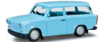
ab Oktober 2013 lieferbar! delivery in October 2013 027359-002 Trabant 1.1 Universal Farbneuheit: pastellblau / pastel blue 9,50 €