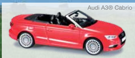
Audi A3® Cabrio