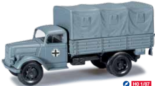
744591 Opel Blitz Planen-LKW / Opel Blitz truck with canvas