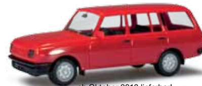
ab Oktober 2013 lieferbar! delivery in October 2013 024266-003 Wartburg 353 Tourist '85 Farbneuheit: hellrot / light red 9,50 €