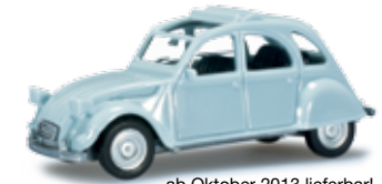
ab Oktober 2013 lieferbar! delivery in October 2013 020824-004 Citroen 2 CV Farbneuheit: hellblau / light blue 10,50 €