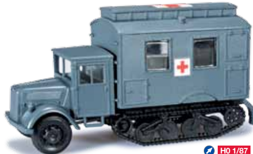
744683 Deutz Halbkettenfahrzeug / Deutz half-track „Sanitäter“